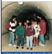
Un gruppo di persone che stanno a ridosso del nuovo servizio idrico Municipali SpA, partecipò al progetto di realizzazione dell'acquedotto nella città di Ancona e al servizio dell'acqua.

La portata della sorgente è compresa tra un minimo di 2.269 litri/secondo e un massimo di 3.314 litri/secondo, se ne prelevano e distribuiscono circa 1.200 litri/secondo.