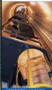
Interno di un tunnel di acqua.

La pioggia penetra nella montagna attraversando varie stratificazioni fino a quando incontra uno strato marmoreo, quindi risale.