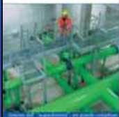
Una galleria di rifranchimento della D. Acqua.

Dopo anni d'interventi e dopo aver affrontato e superato ostacoli di ogni tipo, nel 1968 l'acquedotto di Gorgonzio entrò in funzione e andò ad alimentare i comuni consorziati e, successivamente con nuove opere di adeguamento, il resto dei comuni della provincia.